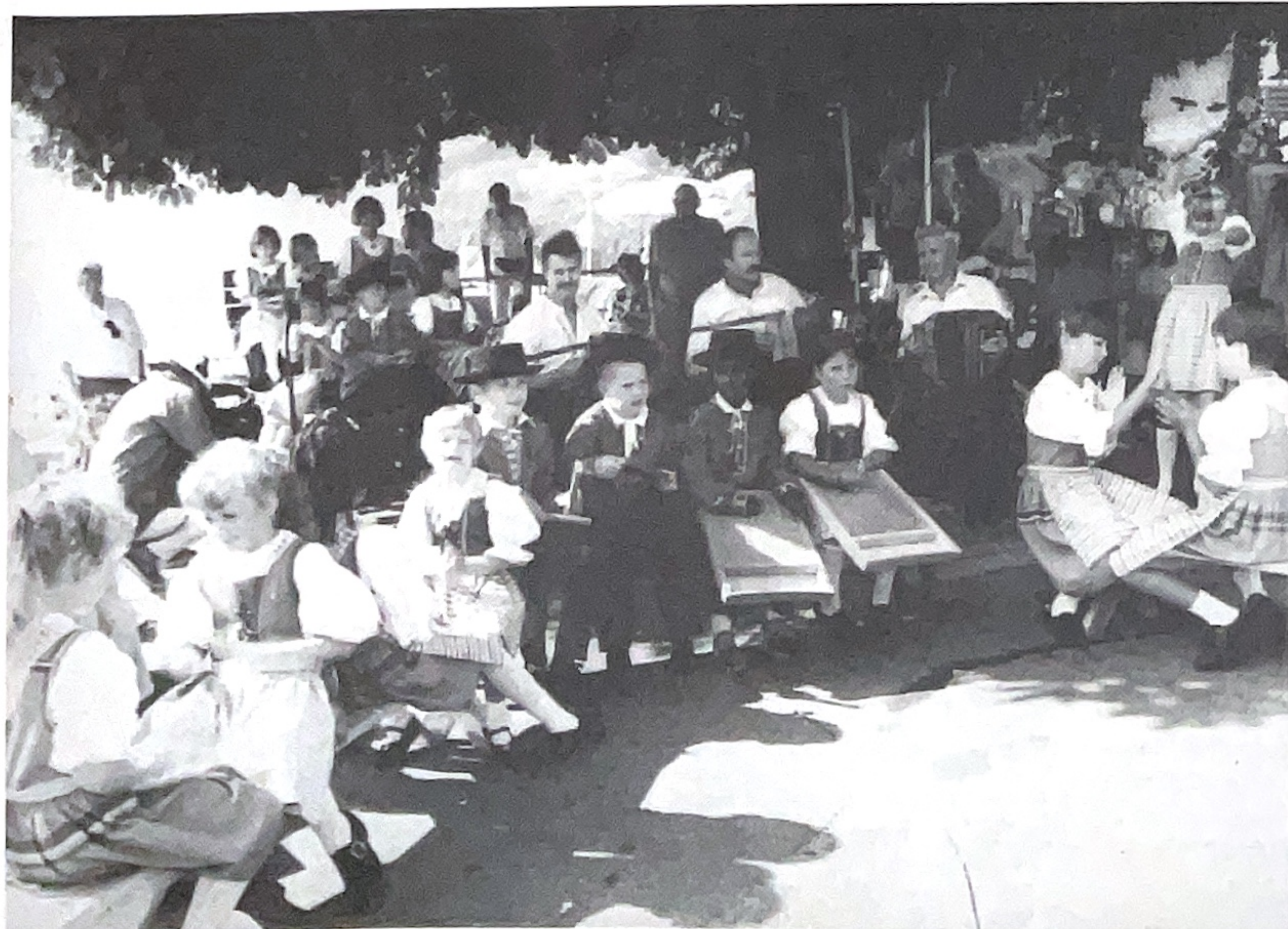
Die Vitznauer Kindertrachtengruppe beim singen und musizieren während den Fernsehaufnahmen.